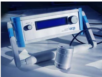
CombiSens S850 med 4-linje LCD display

CombiSens L850 är den kompletta utrustningen för den ambitiösa kvalitetsoperatören i produktionsprocessen.. Standard mät huvud MK850 med integrerad skärm, touch-screen-funktion och integrerad printer